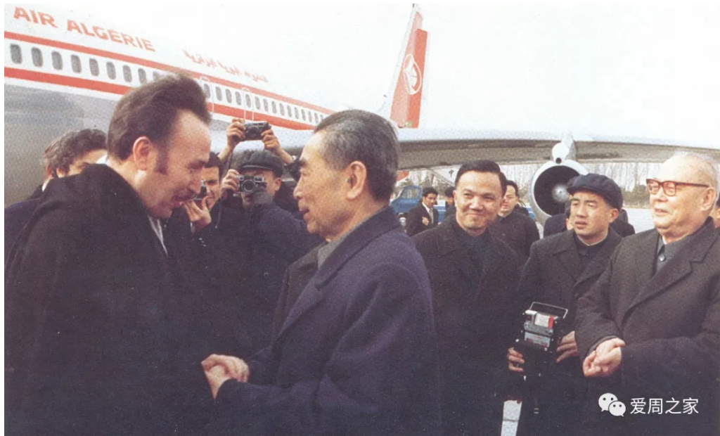
1974年2月25日，周恩来同叶剑英在首都机场欢迎来我国访问的阿尔及利亚革命委员会主席兼政府总理胡阿里-布迈丁。