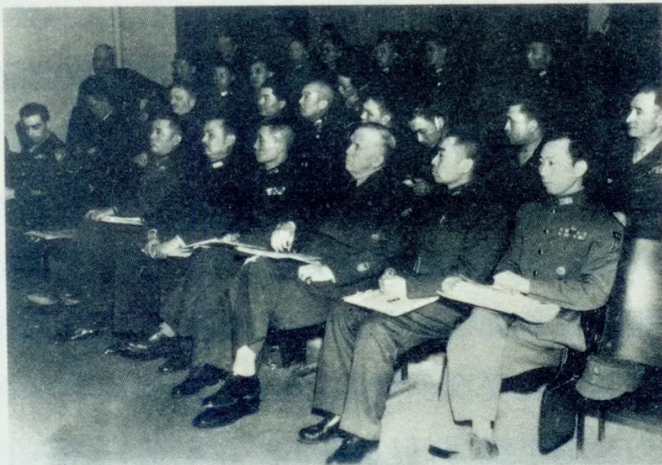
1946年2月28日，军事三人小组飞抵北平，同军调部三委员举行会议。前排右二起：周恩来、马歇尔、张治中、叶剑英、郑介民。