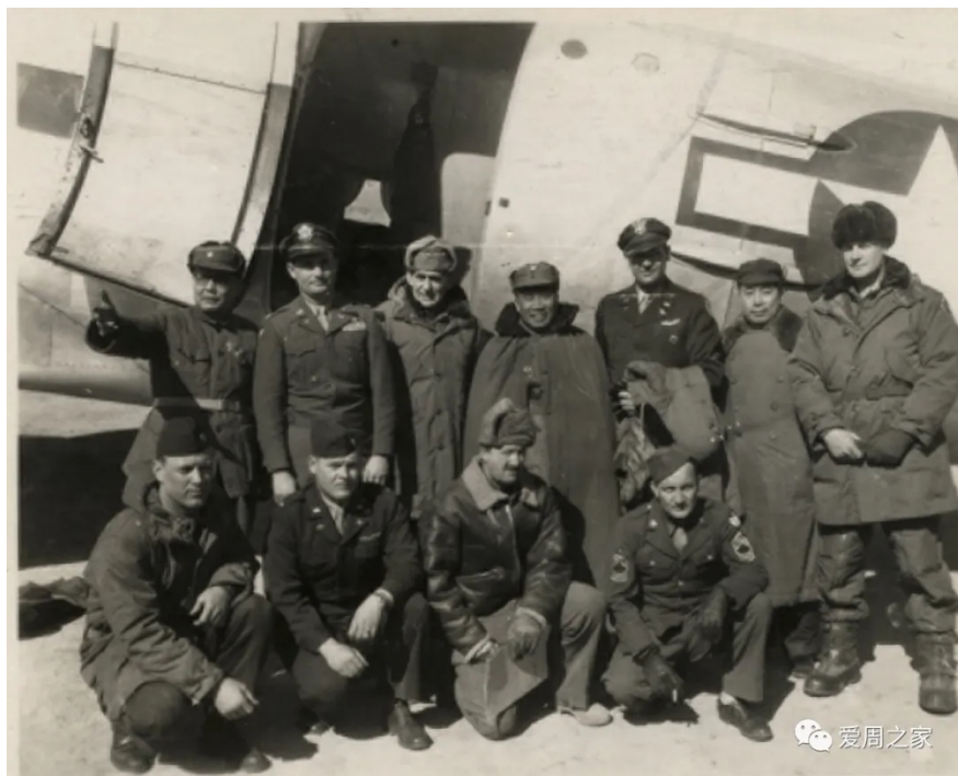
1947年3月，叶剑英率 北平军调处人员乘美国军 用飞机撤回延安，周恩来 和朱德等到东关机场迎接 时与机组人员合影。