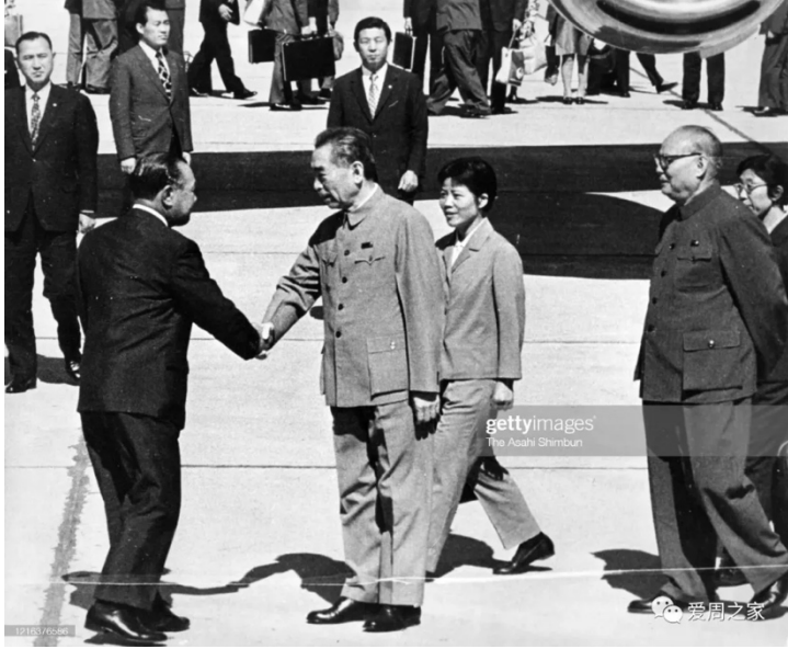
1972年9月，周恩来、叶剑英等在机场欢迎来华访问的日本首相田中角荣。