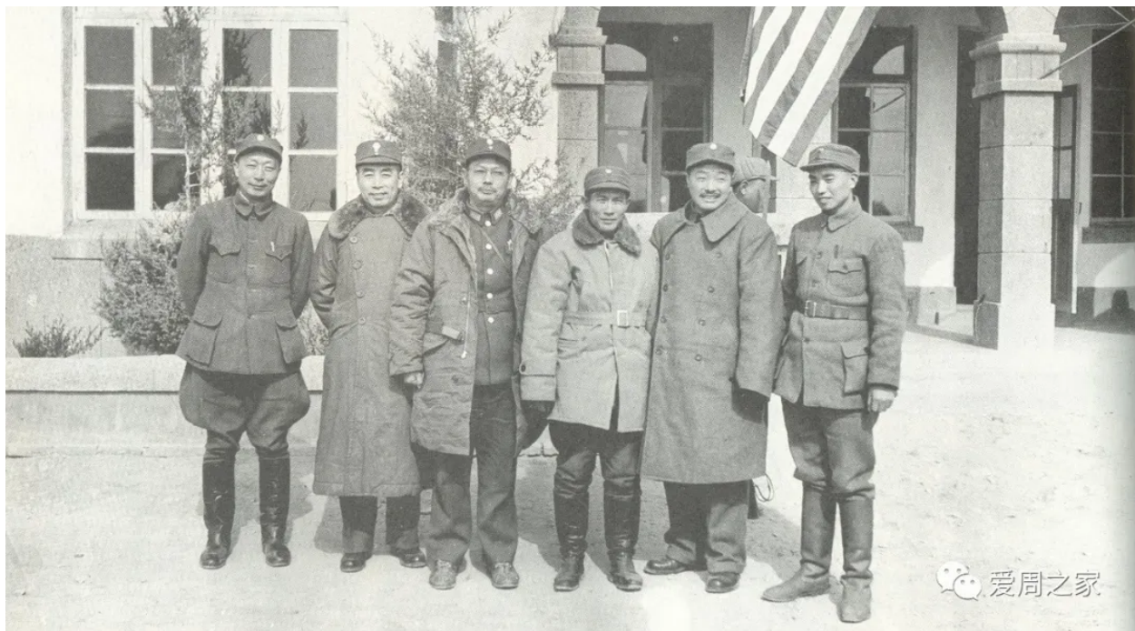
1946年3月1日，周恩来、张治中、马歇尔等军事调处执行部成员视察张家口。 左起：聂荣臻、周恩来、叶剑英、蔡树藩、贺龙、肖克。